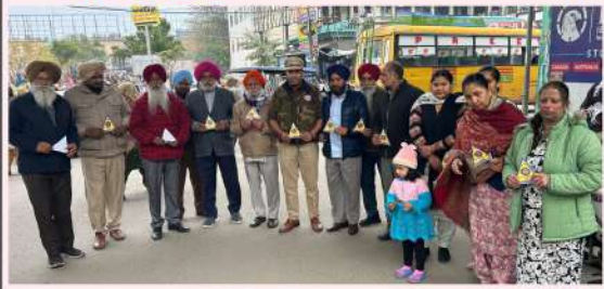
ਸਰਬੱਤ ਦਾ ਭਲਾ ਚੈਰੀਟੇਬਲ ਟਰੱਸਟ ਇਕਾਈ ਮੋਗਾ ਵੱਲੋਂ ਟਰੈਫਿਕ ਇੰਚਾਰਜ ਮੋਗਾ ਦੇ ਸਹਿਯੋਗ ਨਾਲ ਹੁੰਦੇ ਹਨ ਜਿਵੇਂ ਵੱਖ-ਵੱਖ ਵਾਪਰਦੇ ਹਾਦਸਿਆਂ ਨੂੰ ਰੋਕਣ ਲਈ ਬਿਨਾ ਬੈਕ ਲਾਈਟਾਂ ਦੇ ਵਾਹਨਾਂ ਦੇ ਰਫਲੈਕਟਰ ਲਗਾਏ ਗਏ। ਫੋਟੋ ਤੇ ਵੇਰਵਾ: ਭਵਨਦੀਪ ਸਿੰਘ