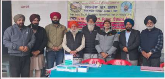
ਸਰਬੱਤ ਦਾ ਭਲਾ ਚੈਰੀਟੇਬਲ ਟਰੱਸਟ ਇਕਾਈ ਮੋਗਾ ਵੱਲੋਂ ਕੋਟ-ਈਸੇ-ਖਾਂ ਵਿਖੇ ਅੱਖਾਂ ਦੇ 670 ਵੇ ਕੈਂਪ ਮੌਕੇ 300 ਤੋਂ ਜ਼ਿਆਦਾ ਮਰੀਜ਼ਾਂ ਦੀਆਂ ਅੱਖਾਂ ਦਾ ਚੈਕ-ਅਪ ਕੀਤਾ ਗਿਆ। ਜ਼ਰੂਰਤ ਮੰਦਾਂ ਨੂੰ ਮੁਫਤ ਦਵਾਈ ਦਿੱਤੀ ਗਈ ਅਤੇ 43 ਮਰੀਜ਼ਾਂ ਦੇ ਮੁਫਤ ਅਪ੍ਰੈਸ਼ਨ ਕੀਤੇ ਗਏ। ਕੈਂਪ ਸਮੇਂ ਮੋਗਾ ਇਕਾਈ ਦੇ ਅਹੁੱਦੇਦਾਰ ਅਤੇ ਪ੍ਰਬੰਧਕ।