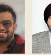
ਚਿਤਕੇਸ਼ ਗੋਲਾਟੀ ਕ੍ਰਿਸ਼ਨਾ ਦੀ ਕੁਲਫੀ (ਬਰਲਡ ਫੈਮਸ) ਪੰਡਾਰਾ ਰੋਡ, ਨਵੀਂ ਦਿੱਲੀ