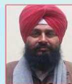
ਮਨਜੋਤ ਸਿੰਘ ਰੀਸਾ ਮੁੱਖ ਫੋਟੋਗ੍ਰਾਫਰ/ ਕੈਮਰਾਮੈਨ