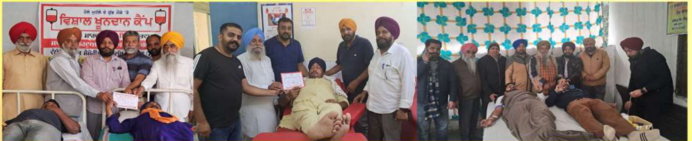
ਰੂਰਲ ਐਨ.ਜੀ.ਓ. ਵੱਲੋਂ ਵੱਖ-ਵੱਖ ਕਲੱਬਾਂ ਦੇ ਸਹਿਯੋਗ ਨਾਲ ਵੱਖ-ਵੱਖ ਪਿੰਡਾਂ ਵਿੱਚ ਖੂਨਦਾਨ ਲਗਾਏ ਜਾਂਦੇ ਹਨ।