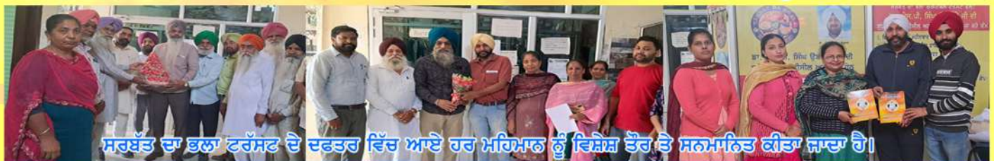
ਸਰਬੱਤ ਦਾ ਭਲਾ ਟਰੱਸਟ ਦੇ ਦਫਤਰ ਵਿੱਚ ਆਏ ਹਰ ਮਹਿਮਾਨ ਨੂੰ ਵਿਸ਼ੇਸ਼ ਤੌਰ ਤੇ ਸਨਮਾਨਿਤ ਕੀਤਾ ਜਾਦਾ ਹੈ।