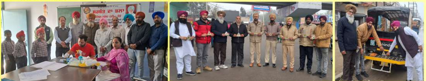
ਮੋਗਾ ਜਿਲ੍ਹੇ ਵਿੱਚ ਸਰਬੱਤ ਦਾ ਭਲਾ ਟਰੱਸਟ ਵੱਲੋਂ 3 ਸਿਲਾਈ ਸੈਂਟਰ, 2 ਕੰਪਿਊਟਰ ਸੈਂਟਰ ਅਤੇ ਇੱਕ ਬਿਊਟੀਸ਼ਨ ਸੈਂਟਰ ਚੱਲ ਰਹੇ ਹਨ।