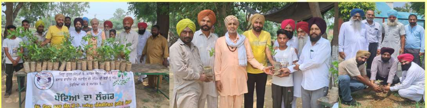
ਰੂਰਲ ਐਨ.ਜੀ.ਓ. ਮੋਗਾ ਵੱਲੋਂ ਹਰ ਸਾਲ ਆਪਣੇ ਵੱਖ-ਵੱਖ ਬਲਾਕਾ ਰਾਹੀਂ ਮੌਸਮ ਅਤੇ ਮੌਕੇ ਅਨੁਸਾਰ ਹਜ਼ਾਰਾਂ ਪੌਦੇ ਲਗਾਏ ਜਾਂਦੇ ਹਨ।

ਵੱਲੋਂ: ਜਿਲ੍ਹਾ ਰੂਰਲ ਐਨ.ਜੀ.ਓ. ਕਲੱਬਜ਼ ਐਸੋਸੀਏਸ਼ਨ (ਰਜਿ:) ਮੋਗਾ ਜਿਲ੍ਹਾ ਰੂਰਲ ਐਨ.ਜੀ.ਓ. ਕਲੱਬਜ਼ ਐਸੋਸੀਏਸ਼ਨ (ਰਜਿ:) ਮੋਗਾ ਵੱਲੋਂ ਕੀਤੇ ਜਾ ਰਹੇ ਕਾਰਜ