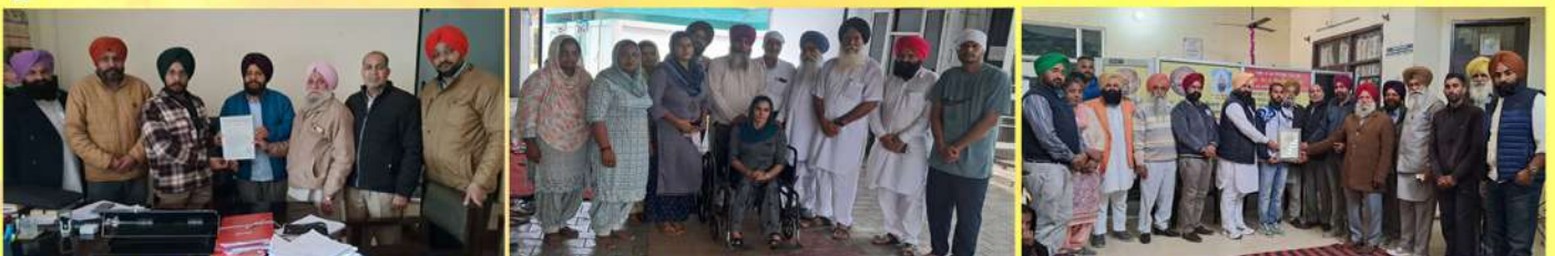
ਹੋਰ ਗਤੀਵਿਧੀਆਂ: ਚਾਈਨਾ ਡੋਰ ਤੇ ਪਬੰਧੀ ਲਗਾਉਣ ਸਬੰਧੀ ਮੰਗ ਪੱਤਰ, ਜਰੂਰਤਮੰਦਾਂ ਨੂੰ ਟਰਾਈ ਸਾਈਕਲ, ਹੋਣਹਾਰ ਖਿਡਾਰੀਆਂ ਦਾ ਸਨਮਾਨ