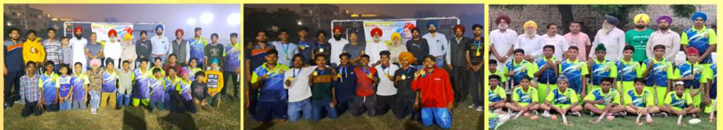
ਨੌਜਵਾਨਾਂ ਨੂੰ ਖੇਡਾ ਪ੍ਰਤੀ ਉਤਸਾਹਿਤ ਕਰਨ ਲਈ ਹੋਣਹਾਰ ਖਿਡਾਰੀਆਂ ਨੂੰ ਹਾਕੀ ਦੀ ਕਿੱਟਾ ਆਦਿ ਮੁਹੱਈਆ ਕਰਵਾਈਆਂ ਜਾਦੀਆ ਹਨ।