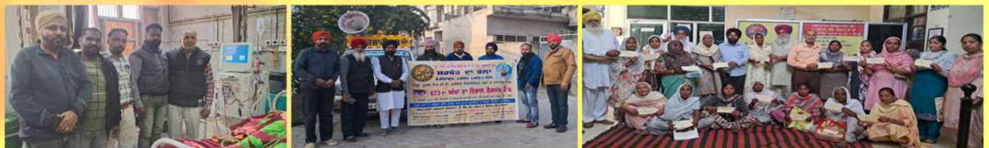
ਅੱਖਾਂ ਦੇ ਮੁਫਤ ਚੈਕਅਪ ਤੇ ਅਪ੍ਰੈਸ਼ਨ ਕੈਂਪ ਲਗਾਏ ਜਾਦੇ ਹਨ ਅਤੇ ਹਰ ਮਹੀਨੇ 150 ਵਿਧਵਾ ਔਰਤਾਂ ਨੂੰ ਪੈਨਸ਼ਨ ਦਿੱਤੀ ਜਾਦੀ ਹੈ।