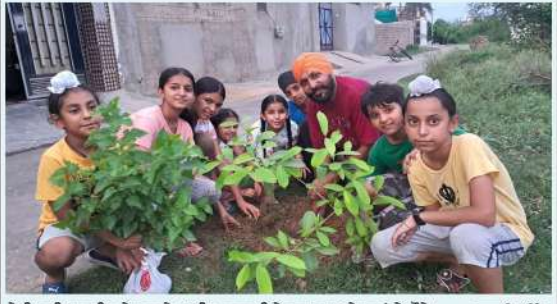
ਮੋਰੀ ਜੂਨੀਅਰ ਟੀਮ ਨੇ ਲਗਾਏ ਅਜੀਤ ਨਗਰ ਵਿਖੇ ਜਾਮਣਾ ਅਤੇ ਤੂੜਾਂ ਦੇ ਪੌਦੇ। -ਭਵਨਦੀਪ ਸਿੰਘ