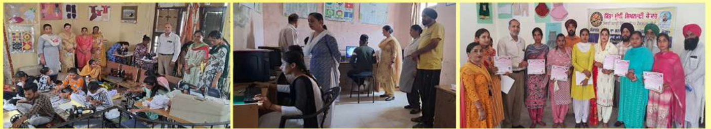
ਮੋਗਾ ਜਿਲ੍ਹੇ ਵਿੱਚ ਸਰਬੱਤ ਦਾ ਭਲਾ ਟਰੱਸਟ ਵੱਲੋਂ 3 ਸਿਲਾਈ ਸੈਂਟਰ, 2 ਕੰਪਿਊਟਰ ਸੈਂਟਰ ਅਤੇ ਇੱਕ ਬਿਊਟੀਸ਼ਨ ਸੈਂਟਰ ਚੱਲ ਰਹੇ ਹਨ।