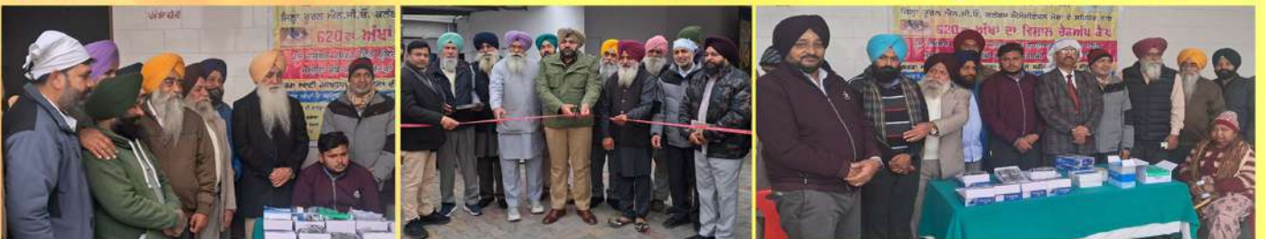
ਰੂਰਲ ਐਨ.ਜੀ.ਓ. ਵੱਲੋਂ ਵੱਖ-ਵੱਖ ਕਲੱਬਾਂ ਦੇ ਸਹਿਯੋਗ ਨਾਲ ਵੱਖ-ਵੱਖ ਪਿੰਡਾਂ ਵਿੱਚ ਅੱਖਾਂ ਦੇ ਕੈਂਪ ਲਗਾਏ ਜਾਂਦੇ ਹਨ।