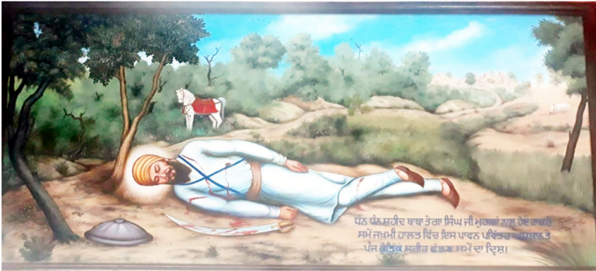
ਪੰਨ ਪੰਨ ਸ਼ਹੀਦ ਬਾਬਾ ਤੇਗ ਸਿੰਘ ਜੀ ਮੁਗਲਾਂ ਨਾਲ ਹੋਏ ਵਾਰਾਂ ਸਮੇਂ ਜਮਖੀ ਹਾਲਤ ਵਿੱਚ ਇਸ ਪਾਵਨ ਪਵਿੱਤਰ ਗੁਰਦੁਆਰੇ 'ਤੇ ਪੰਨ ਛੇਤਿਕ ਸ਼ਹੀਦ ਛੱਡਣ ਸਮੇਂ ਦਾ ਦ੍ਰਿਸ਼।